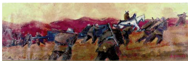
SMAŽIL Antonín: Vpred za slobodu I. 1974, olej, lepenka, 35x100