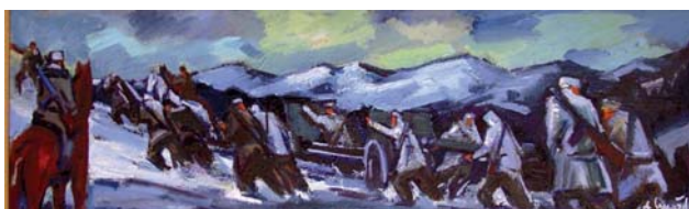
SMAŽIL Antonín: Vpred za slobodu II. 1974, olej, sololit, 37x125