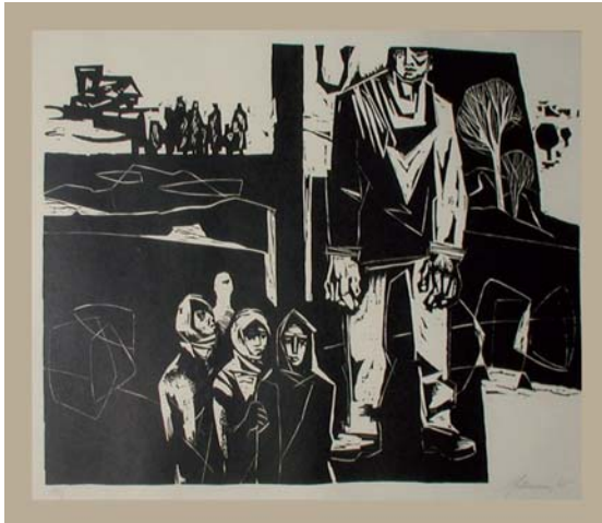
SCHURMANN Ivan: Do povstania 1965, papier