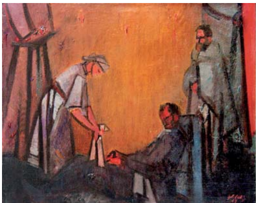
ŽELIBSKÝ Ján: Ranený 1967, olej, plátno, 73x92