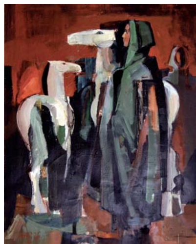
ILAVSKÝ Ján: Podvečer 1974, olej, plátno, 116x90