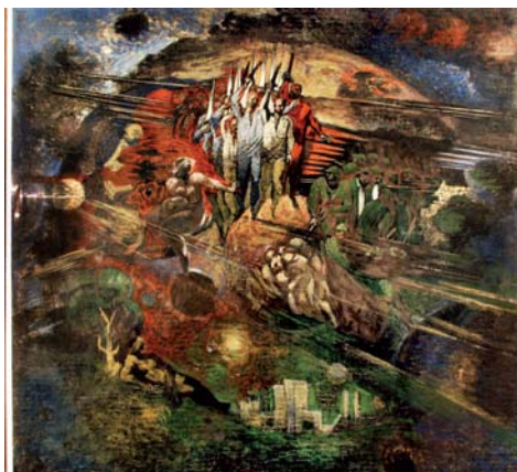
GAJDOŠ František: SNP 1975, tempera, papier, 83x95