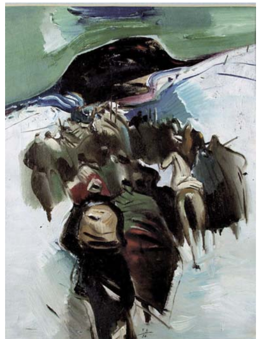
HLOŽNÍK Ferdinand: Pochod partizánov do hôr 1956, tempera, papier, 60x40