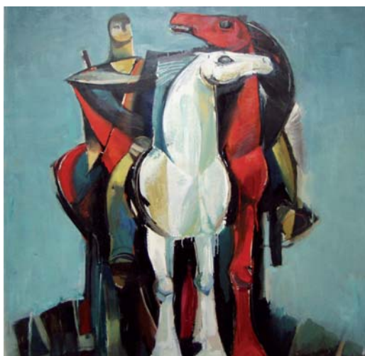
ILAVSKÝ Ján: Hliadka 1971, olej, plátno, 130x120