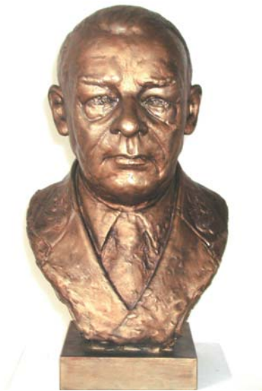
VALACH Peter: generál Rudolf Viest 2003, epoxid, 50x30x30