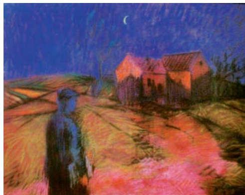
ŽELIBSKÝ Ján: Kolportovanie ilegálnej tlače 1962, pastel, papier, 80x100