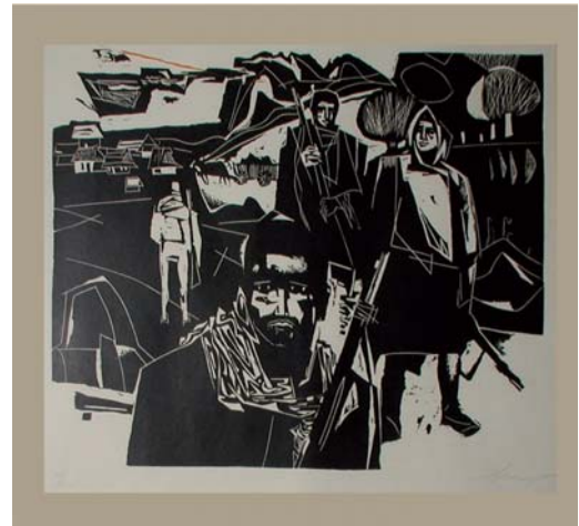
SCHURMANN Ivan: Partizánska dedina 1965, papier