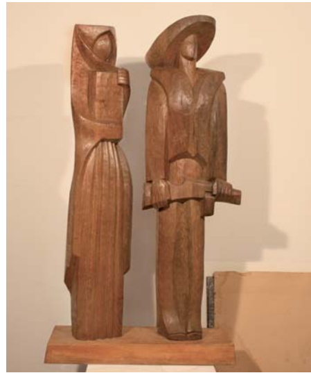
KORKOŠ Ludwik: Pieseň o SNP 1963, drevo, 110x59x21