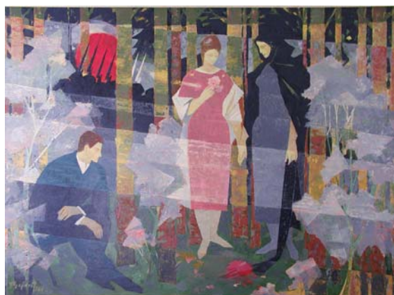
GAJDOŠ František : Spomienka na povstaleckú vojnu ; 1964, olej, plátno, 130x180